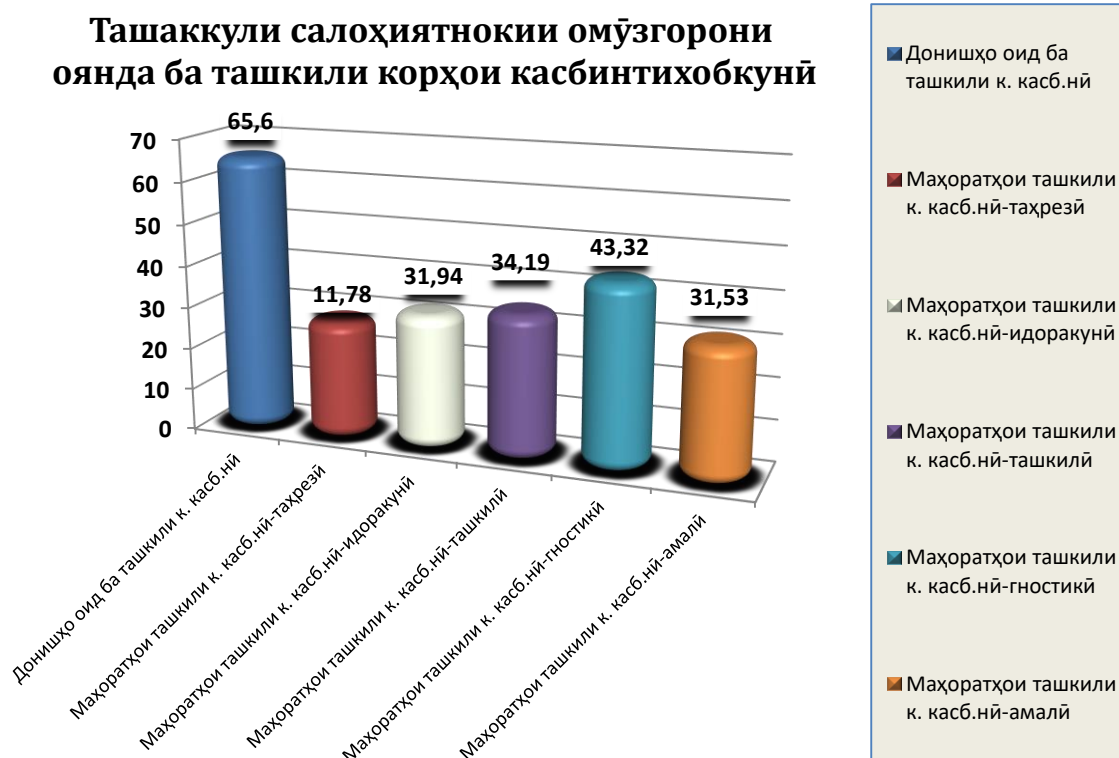
Ҷадвали 14. Диаграммаи ташаккули салоҳиятнокии омӯзгорони оянда ба ташкили корҳои касбинтиҳобкунӣ дар макотиби олиии Ҷумҳурии Тоҷикистон

Холи миёнаоморӣ (4,64), ки коршиносон (экспертҳо) бо донишҳо оид ба корҳои касбинтиҳобкунӣ гузоштаанд, аз аҳаммияти баланди онҳо