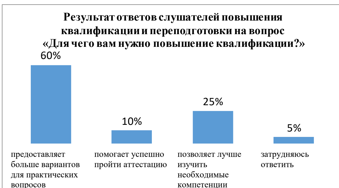
Рисунок 1. Ответы слушателей курса повышения квалификации на вопрос «Для чего Вам нужно повышение квалификации»

По мотивам обучения, которые играют роль фактора развития профессиональной активности учителя в процессе повышения квалификации, опрос в основном проводился среди слушателей, который показывает нам итоговые результаты курсов. Ниже приводятся результаты их ответов на вопрос «Для чего вам нужно повышение квалификации?» (учитывался тот ответ слушателя, который он посчитал наиболее необходимым), проанализированные нами по завершении курсов