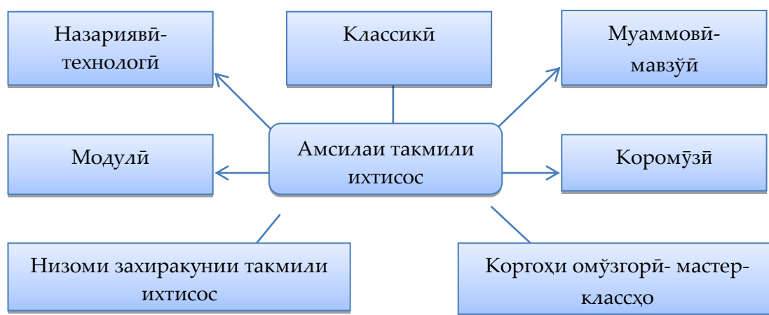
Расми 2. Амсилаи такмили ихтисос.

Дар боби мазкур амсилаҳои такмили ихтисос мавриди таҳлил қарор дода шудааст, ки онҳо дар раванди такмили ихтисоси кормандони соҳаи маориф истифода мешаванд: